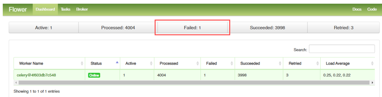
Рис. 2: Статус Failed

На страницу Dashboard необходимо отслеживать количество задач со статусом Failed (Рисунок 2).