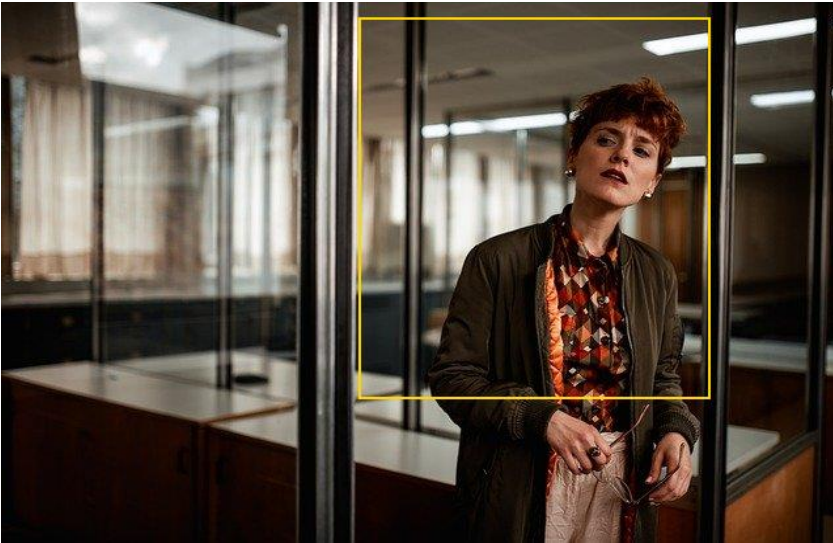
Исходный кадр с зоной ROI

Указанная прямоугольная область вырезается из кадра и именно это изображение в дальнейшем обрабатывает Face Stream.