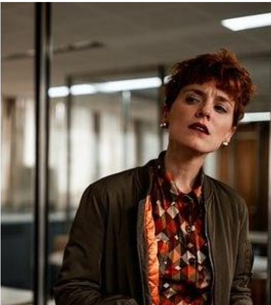
Вырезанная область кадра, используемая для обработки в Face Stream

Указанная прямоугольная область вырезается из кадра и именно это изображение в дальнейшем обрабатывает Face Stream.